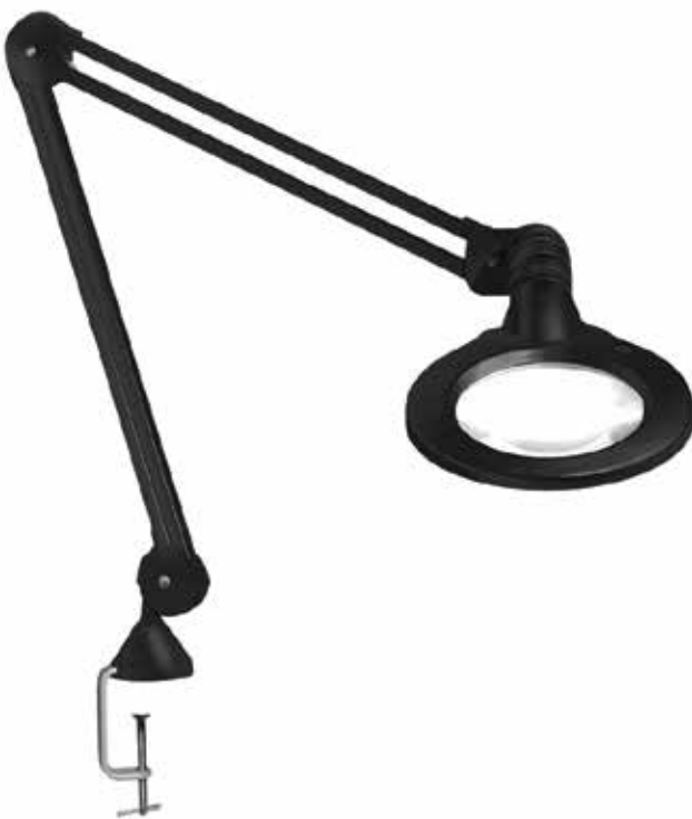
KFM LED 放大倍率