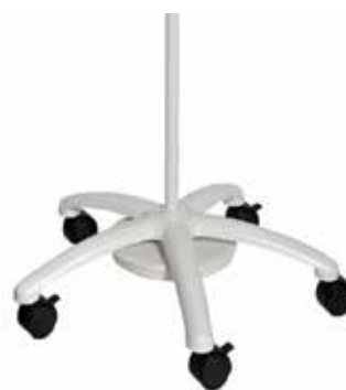
加重滚轮落地支架