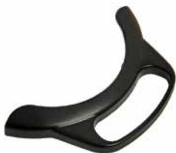
KFM LED 手柄